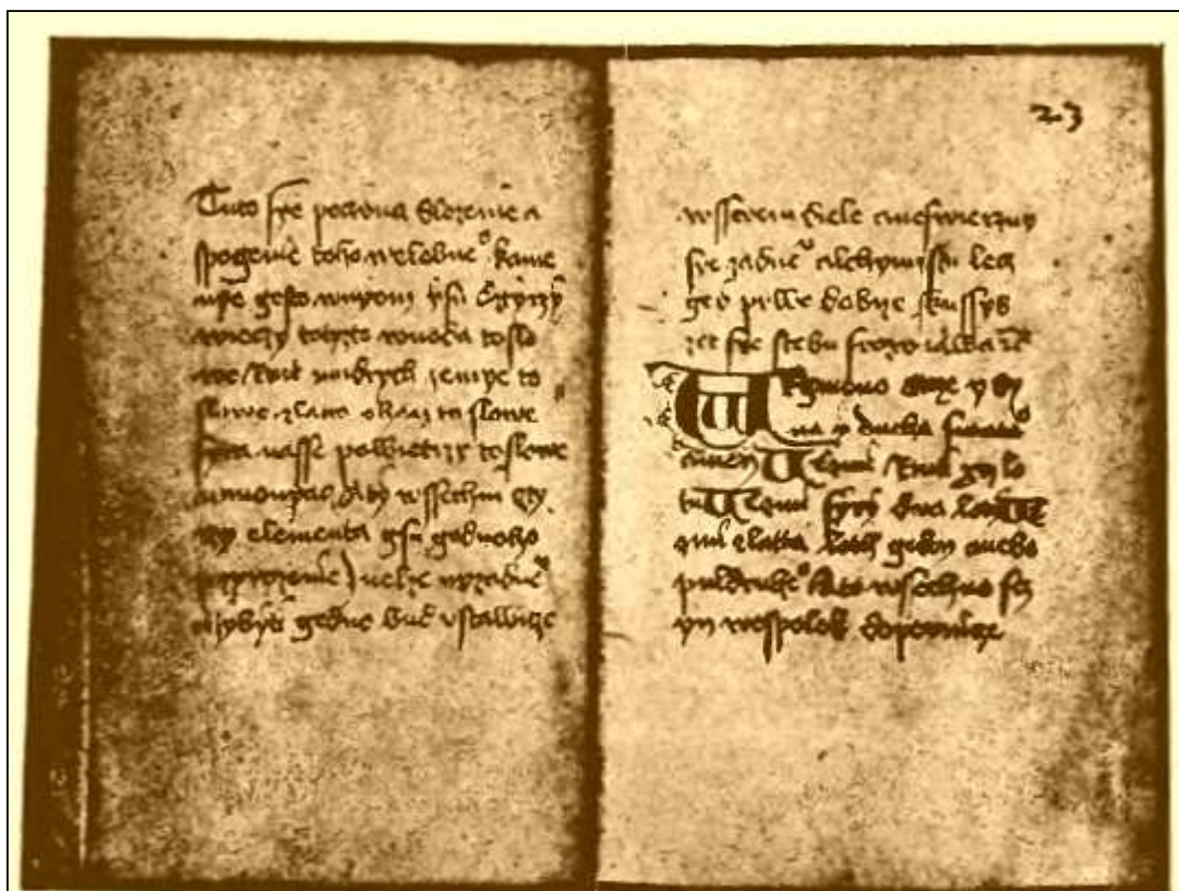
Fotografický snímek originalu, chovaného v Museu království Českého.

Nu a ti všichni dohromady je potvrzují to, že jsme prostě nebyli na toto datum připraveni - a co víc, že nemáme žádného kandidáta, který by nám krásně zapadl do této doby.