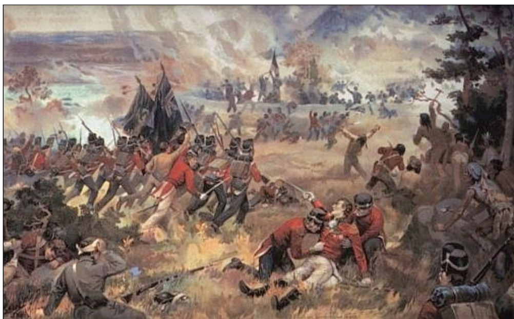
Bitva u Queenstone Heights

velkých severoamerických jezerech. V Kanadě se bojovalo v Ontáriu (tehdejší Upper Canada ) a Quebecu ( Lower Canada ) a to na suchu i na vodě. Šlo o to zabrat důležité přístavy; tak například Britům se tím podařilo u jezera Erie zablokovat veškerý přísun zboží do Států ze západu. Také námořní bitvu v Quebecu na jezeře Champlain vyhráli. Válečné lodi tehdy křížovaly severoamerická jezera a sváděly bitvy stejně urputné, jako byly ty v Atlantiku. O jedné takové bitvě, malé, ale důležitější než ty ostatní si tu povíme . . .