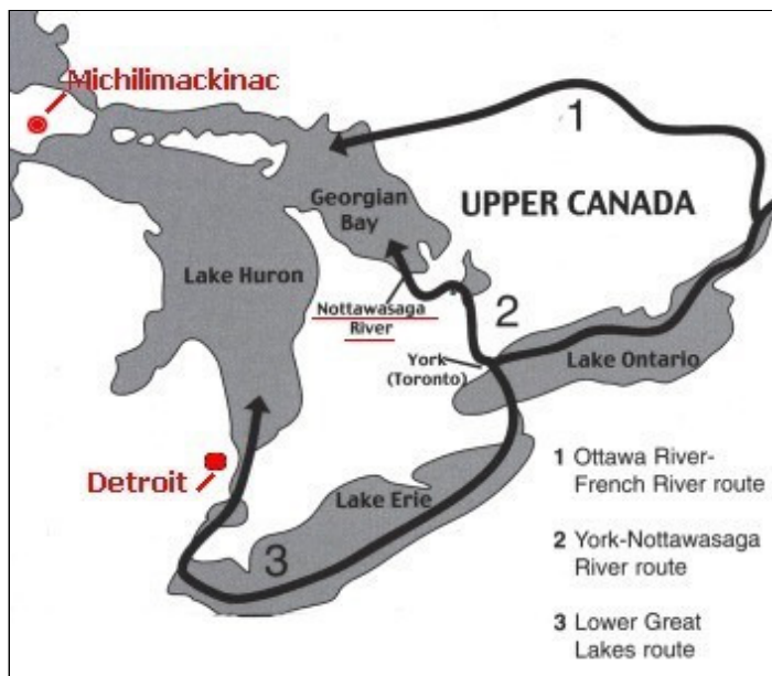
Mapa vodních cest, vlevo nahoře pevnost Michilimackinac