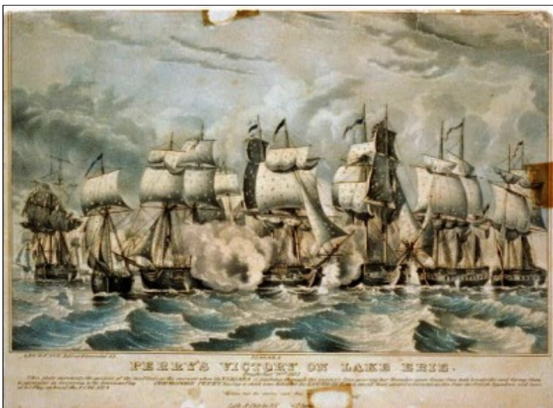
Perryho vítězství na Lake Erie

kdysi v roce 1805 bojoval s Nelsonem u Trafalgaru, to ještě jako čtrnáctiletý plavčík. V této válce se vyznamenal, v květnu 1814 odvážně přepadl pevnost Oswego ve státě New York. A v červenci se už s 22 námořníky a vojáky Královského regimentu z Nového Foundlandu vydal po souši z Kingstonu, ležícím na jezeře Ontario, k zálivu Gregorian Bay na Huronu. A 2 srpna se potkali v ústí řeky Nottawasaga s naší Nancy, která tam kotvila.