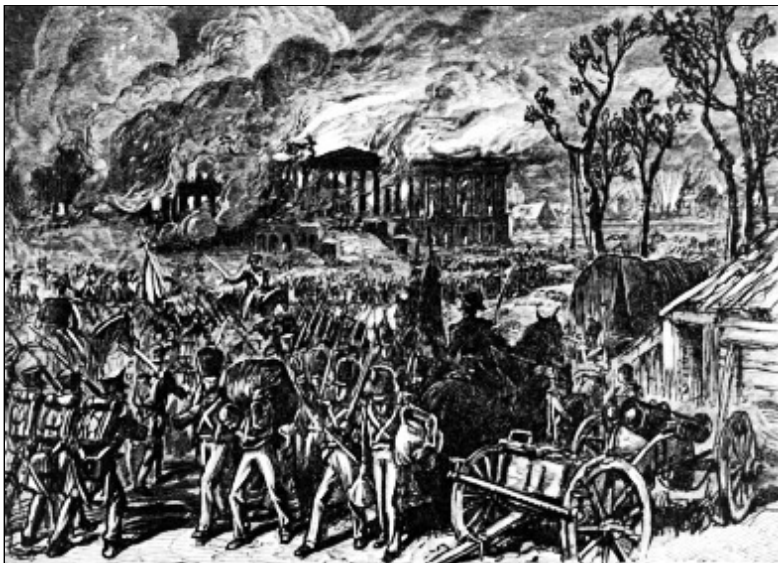
Hořící Bílý dům

Zatímco Napoleon vyhlásil svou kontinentální blokádu evropských přístavů, Britové nelenili a snažili se regulovat obchod jinde, hlavně v Severní Americe. To se nelíbilo Američanům a tak došlo k Britsko-Americké válce (vyhlášena 18 června 1812 a trvala až do 1815, ač byl mír podepsán už roku 1814 v holandském Ghentu). A byl tady ještě jeden velký důvod: Britové totiž násilně impresovali námořníky, tj. násilně je rekrutovali do služby na svých válečných lodích. To se v Anglii provádělo tak, že se opilému námořníkovi vrazila (tzv. impresovala :-)) do ruky zlatka a už ho odváděli na loď, kde ráno vystřízlivěl, ale utéci nemohl, Byli daleko od přístavu a musel na lodi pár let sloužit za velmi těžkých podmínek. U Američanů to bylo jinak: ti prostě přepadali britské lodi na moři a námořníky unášeli. Britové ale zase podporovali Indiány v boji proti expanzi amerických osadníků na západ, což se Američanům nehodilo do plánů.