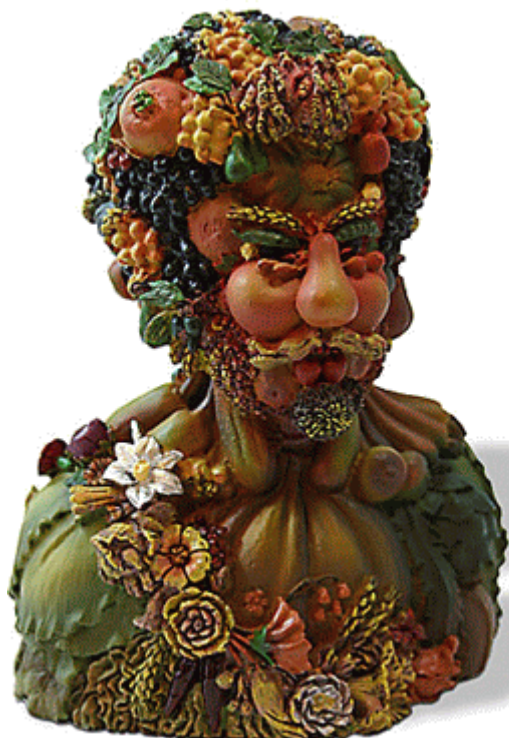
Údajný Rudolf II, podle Arcimbolda , v 3D verzi zde podle http://www.talariaenterprises.com/

Vím, že o těchto pánech už toho bylo napsáno moc a moc a to i na dřívější Enigmě nebo současné Sfinze, ale jen málokdy odolám přechíst si o nich něco znova a doufám, že se dozvím něco nového. Zajásal jsem tedy, když jsem uviděl prosincové číslo časopisu Živá historie, kde na titulní straně byla reprodukce známého portrétu Rudolfa II. Od Arcimbolda. Lákavý byl i titul: Šílenec na českém trůně?